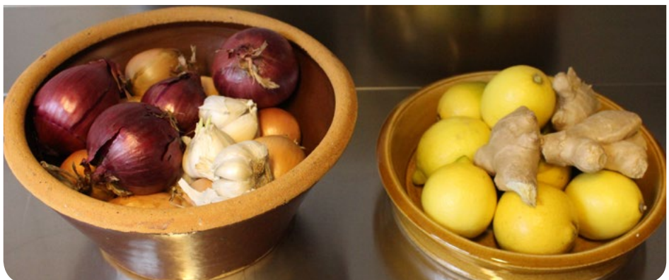
Blieben Sie gesund!